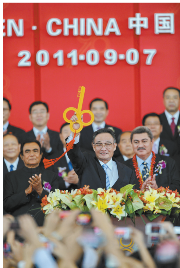
▲二〇一一年九月七日,吴邦国同志在福建厦门出席第十五届中国国际投资贸易洽谈会开幕式。