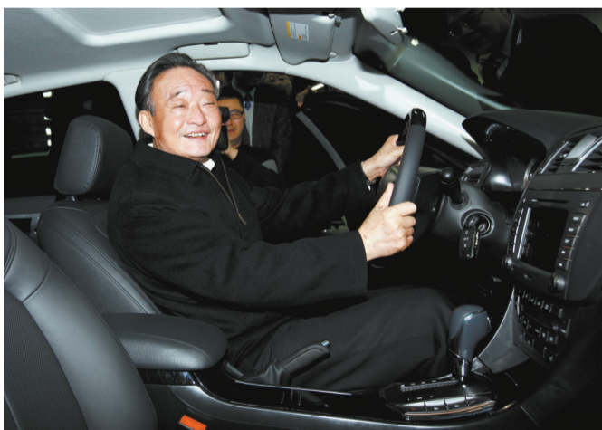
2010年1月30日,吴邦国同志在上海汽车集团股份有限公司技术中心察看新能源样车。