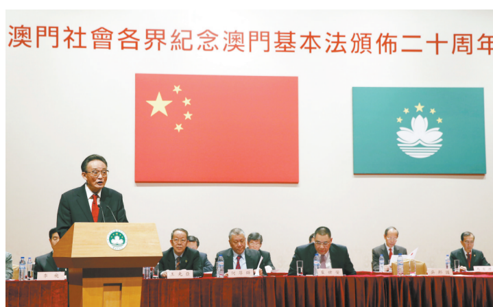
▲2013年2月21日,吴邦国同志在澳门文化中心出席澳门社会各界纪念澳门基本法颁布20周年启动大会并发表讲话。