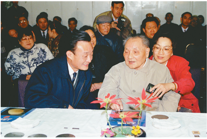
▲1992年2月10日,邓小平同志在上海贝岭微电子制造有限公司参观时与吴邦国同志交谈。