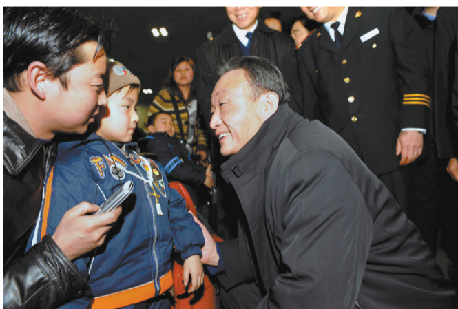
2008年2月3日,吴邦国同志在北京西站候车室与旅客交谈。