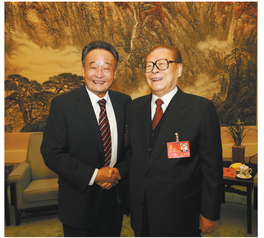
2012年11月14日,中国共产党第十八次全国代表大会在北京闭幕。这是闭幕会前,江泽民同志与吴邦国同志在一起。