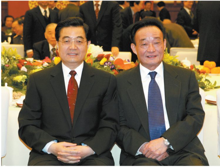
二〇〇五年一月一日,全国政协在北京举行新年茶话会。这是胡锦涛同志与吴邦国同志在一起。