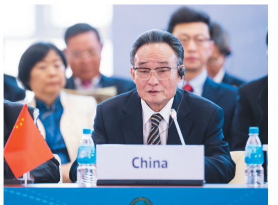
▲2013年1月28日,吴邦国同志在俄罗斯符拉迪沃斯托克出席亚太议会论坛第21届年会,并作题为《坚持和平发展促进合作共赢》的主旨发言。