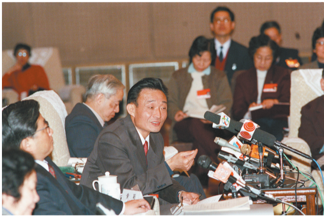
1994年3月,时任上海市委书记的吴邦国同志在全国两会上海代表团全团会议上。

吴邦国同志是中国特色社会主义民主法治建设的重要领导者。他强调,如果没有比较完备的、高质量的法律法规,就谈不上实现社会主义民主政治的制度化、规范化和程序化,就谈不上依法治国、建设社会主义法治国家。在党中央领导下,他将立法工作作为全国人大及其常委会的首要任务,紧紧围绕党中央确定的立法工作目标,坚持科学立法、民主立法,适应社会主义市场经济发展、社会全面进步和加入世贸组织的新形势,把中国特色社会主义法律体系中基本的、急需的、条件成熟的法律作为立法重点,抓紧制定修改相关法律,集中开展法律清理工作。2003年3月,他担任中央立法修改小组组长,在中央政治局常委会领导下主持宪法修改工作。由十届全国人大二次会议通过的宪法修正案,确立了“三个代表”重要思想在国家政治和社会生活中的指导地位,明确国家尊重和保障人权、依法保护公民的私有财产权和继承权等内容,对促进我国经济社会发展、推进中国特色社会主义民主法治建设具有重要意义。在他的主持下,第十届、十一届全国人大及其常委会共审议通过宪法修正案草案、法律草案、法律解释草案和有关法律问题的决定草案186件,包括物权法、企业破产法、企业所得税法、公务员法、行政许可法、治安管理处罚法、劳动合同法、未成年人保护法、妇女权益保障法、关于加强网络信息保护的決定等。 (下转第七版)